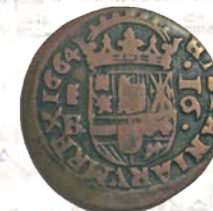
Moneda Real de a cuatro de Carlos III