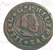
Moneda de 16 maravedís de Felipe IV